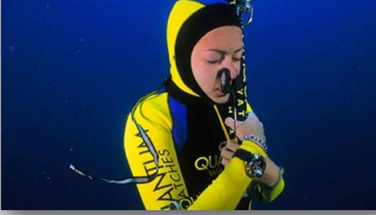
Yasemin Dalkılıç Dünya sualtı dalış rekortmeni